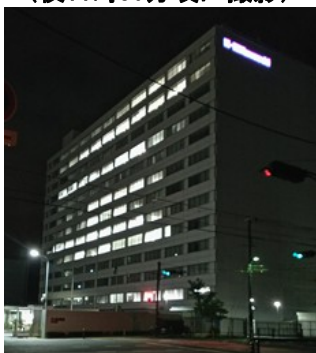
神戸工場の2号館 (夜11時30分頃に撮影)

川重の場合、平日は30分単位の計算になっていきますので、明らかに労基法に反しています。事務の煩雑等の理由は通用しませんので改善すべきです。