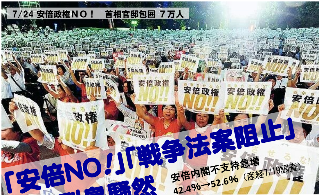
7/24 安倍政権NO! 首相官邸包囲 7万人