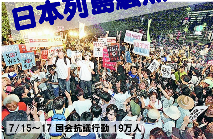
7/15~17 国会抗議行動 19万人

安倍政権は国民主権を真つ向から否定する独裁政治 国民の5割以上が「憲法違反」、国民の8割が「政府は納得のいく説明をしていない」と答えている戦争法案(安全保障関連法案)。7月16日、政府・与党が衆院で強行採決。これは、数の力で主権者国民の多数意思を踏みにじる独裁政治です。