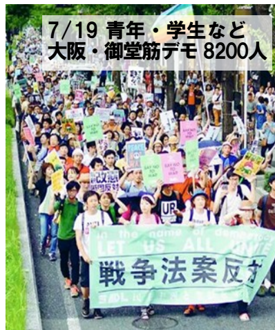
7/19 青年・学生など 大阪・御堂筋デモ 8200人